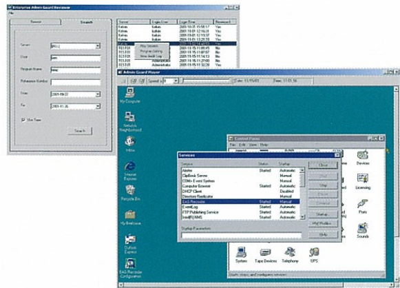
[ログ再生イメージ]

※ENTERPRISE ADMINGUARDはSprint innovations Pte Ltdの登録商標です。 ※その他の企業名や製品名はすべて各社の保有する商標または登録商標です。