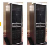
HP NonStop Itanium